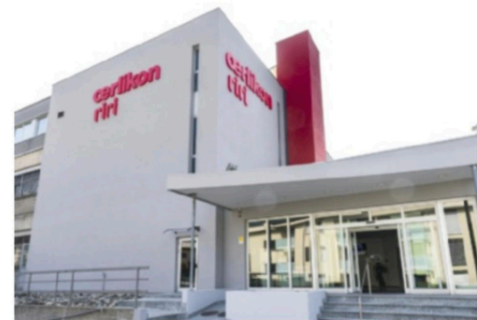
Oerlikon Luxury in numbers (2022)

Since 2023, Riri has become part of the Oerlikon Group, creating Oerlikon Luxury, a leading supplier of accessories for the luxury sector.